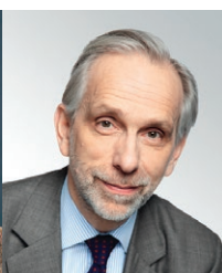
Humbert de Wendel