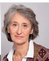
Priscilla de Moustier