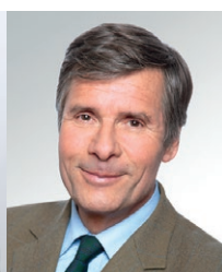
Edouard de l'Espée