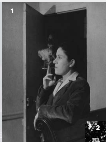
1 / Brassai, Dora Maar dans son atelier rue de Savoie, 1945