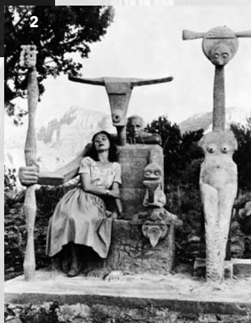
2 / Dorothea Tanning et Max Ernst avec sa sculpture, Capricorn, 1947